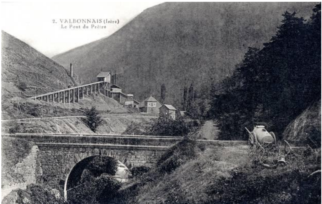
2. VALBONNAIS (Isère) Le Pont du Prêtre

Les vestiges d'une cimenterie (patrimoine industriel)