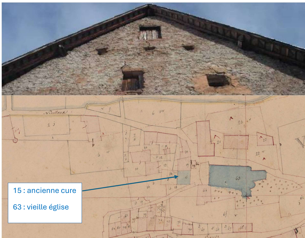
Extrait du cadastre de Valbonnais (1839) et façade de l'ancienne cure aux Nicollaux.